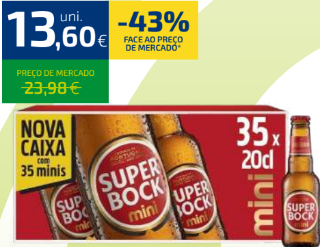
CERVEJA SUPER BOCK MINI 35x20cl T.P. (0,39€/UN)