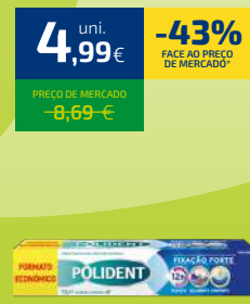
CREME FIXADOR DENTÁRIO POLIDENT 77G (64,81€/KG)