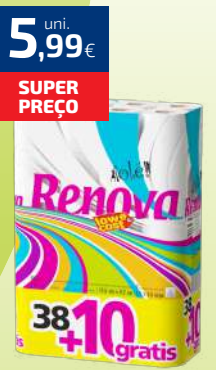
PAPEL HIGIÊNICO RENOVA 38+10 ROLOS OLÉ