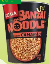
NOODLES CIGALA BANZAI 67G (12,69€/KG)

0,85€ -28% FACE AO PREÇO DE MERCADO* PREÇO DE MERCADO 1,19€