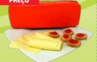
QUEIJO BARRA EDAMER KG (6,29€/KG)