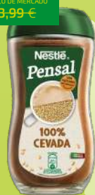
CEVADA PENSAL NESTLÉ 200G (11,45€/KG)

2,29€ -42% FACE AO PREÇO DE MERCADO* PREÇO DE MERCADO 3,99€