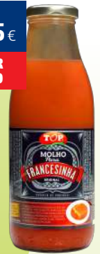
MOLHO DE FRANCESINHA TOP 500ML (3,10€/LT)

2,29€ -42% FACE AO PREÇO DE MERCADO* PREÇO DE MERCADO 3,99€