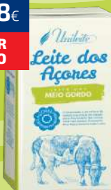
LEITE UNILEITE AÇORES MEIO GORDO 1L (0,68€/LT)