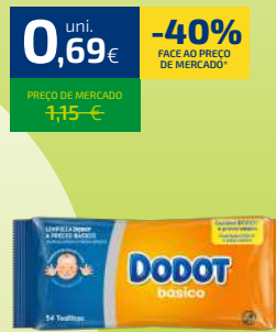
TOALHITAS DODOT BÁSICO 54UN.