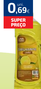
LAVA TUDO BRILHANTE 2L (0,35€/LT)