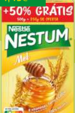
NESTUM MEL NESTLÉ 500+250G (4,79€/KG)

3,59€ -20% FACE AO PREÇO DE MERCADO* PREÇO DE MERCADO 4,49€