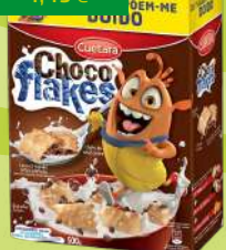
CUÉTARA FLAKES 500G (6,30€/KG)

3,15€ -30% FACE AO PREÇO DE MERCADO* PREÇO DE MERCADO 4,49€