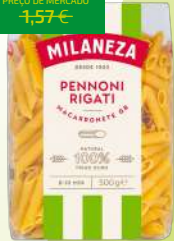
MACARRONETE GR MILANEZA 500G (1,70€/KG)

0,85€ -45% FACE AO PREÇO DE MERCADO* PREÇO DE MERCADO 1,57€