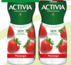
IOGURTES ACTIVIA LÍQUIDOS DANONE 4x155G (3,05€/KG)

1,89€ -44% FACE AO PREÇO DE MERCADO* PREÇO DE MERCADO 3,39€