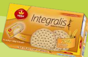
BOLACHAS INTEGRALIS VIEIRA 180G (6,06€/KG)

1,09€ -49% FACE AO PREÇO DE MERCADO* PREÇO DE MERCADO 2,14€