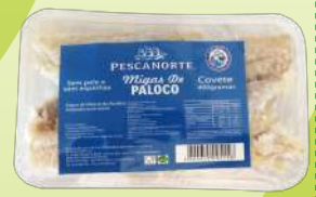
PALOCO DESFIADO PESCANORTE 400G (6,13€/KG)

3,59€ -20% FACE AO PREÇO DE MERCADO* PREÇO DE MERCADO 4,49€