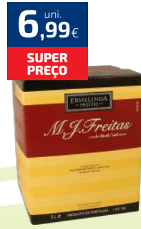
VINHO BOX ERMELINDA FREITAS 5L BR/TT (1,40€/LT)