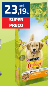
ALIMENTO CÃO FRISKIES 15KG (1,55€/KG)