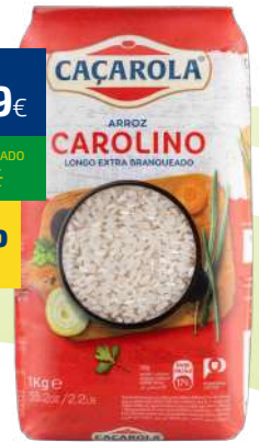
ARROZ CAÇAROLA CAROLINO 1kg (0,99€/KG)

0,99€ -34% FACE AO PREÇO DE MERCADO* PREÇO DE MERCADO 1,49€