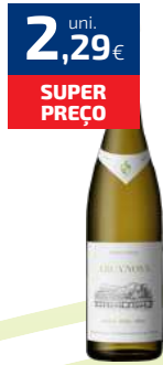
VINHO ARCA NOVA VERDE BRANCO 75CL (3,06€/LT)