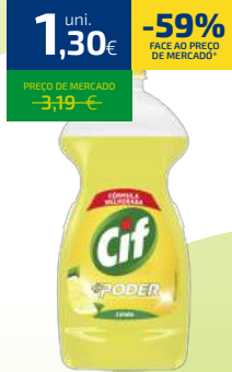
LAVA LOIXA CIF +PODER 600ML (2,17€/LT)