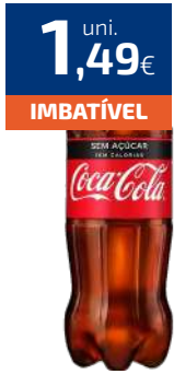
COCA-COLA ZERO 1,5L (0,99€/LT)