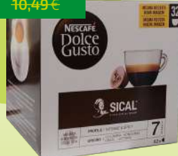
CAFÉ DOLCE GUSTO CÁPSULAS 32UN. (0,28€/UN)

8,65€ -17% FACE AO PREÇO DE MERCADO* PREÇO DE MERCADO 10,49€