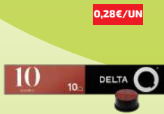
CAFÉ DELTA Q CÁPSULAS 10UN. (0,28€/UN)

2,79€ -44% FACE AO PREÇO DE MERCADO* PREÇO DE MERCADO 4,99€