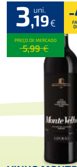
VINHO MONTE VELHO ALENTEJO 75CL (4,26€/LT)