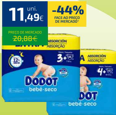
FRALDAS DODOT BEBÊ SECO T3 - 66U/T4 - 62U/T5 - 56U/T6 - 48U