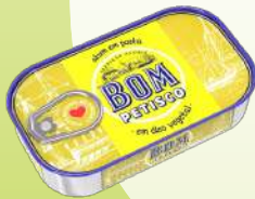
ATUM BOM PETISCO ÓLEO POSTA 120G (8,33€/KG)

1,00€ -42% FACE AO PREÇO DE MERCADO* PREÇO DE MERCADO 1,72€