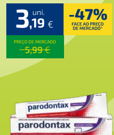
PASTA DOS DENTES PARODONTAX GENGIVAS 75ML CUIDADO DIÁRIO (42,53€/LT)