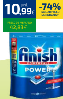
FINISH POWERBALL POWER LOIXA 104UN. (0,11€/UN)