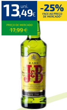
WHISKY J&B RARE 70CL (19,27€/LT)