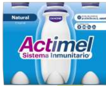
IOGURTES ACTIMEL DANONE 6x100G (4,82€/KG)

2,89€ -22% FACE AO PREÇO DE MERCADO* PREÇO DE MERCADO 3,71€