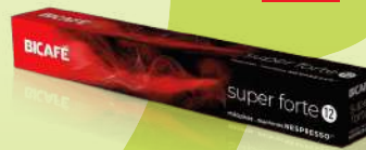
CAFÉ BICAFÉ NESPRESSO 10U (0,16€/UN)