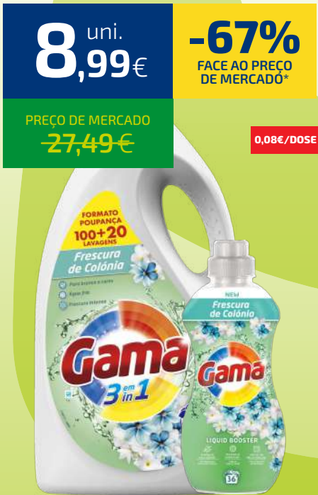
DETERGENTE GAMA 120D COLÔNIA (0,08€/DOSE) + PERFUMADOR GAMA 36D COLÔNIA