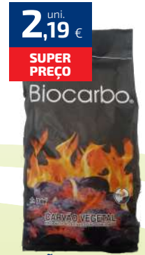
CARVÃO BIOCARBO 7DM3