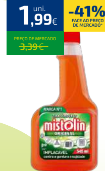
TIRA GORDURAS MISTOLIN PISTOLA 545ML (3,65€/LT)